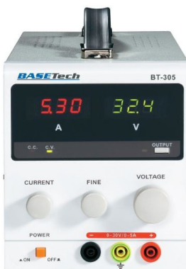
Fig. 1: labvoeding.